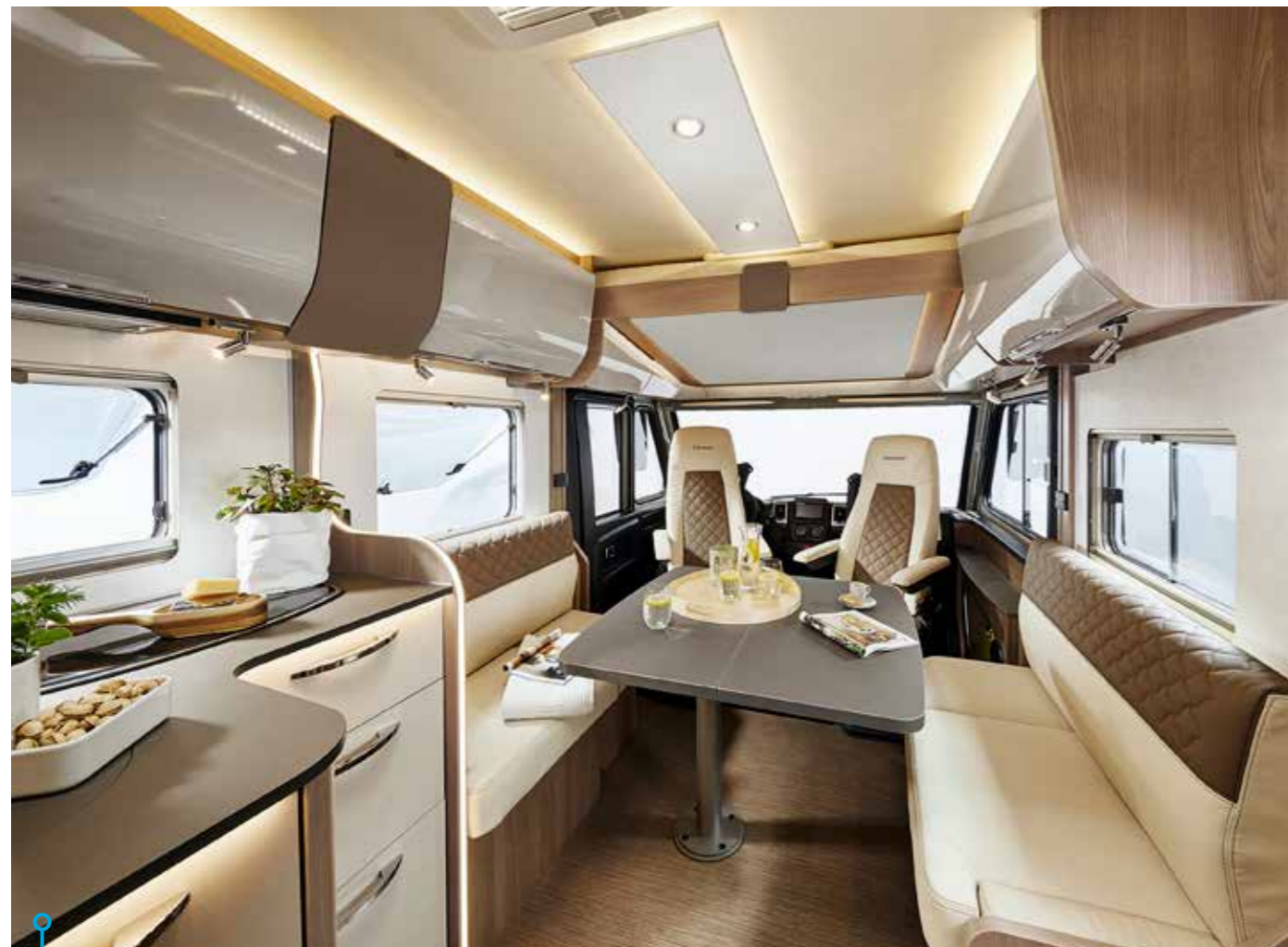
Ljus, elegant inredning med välvda skåpluckor och som synes face-to-face-sittgrupp.