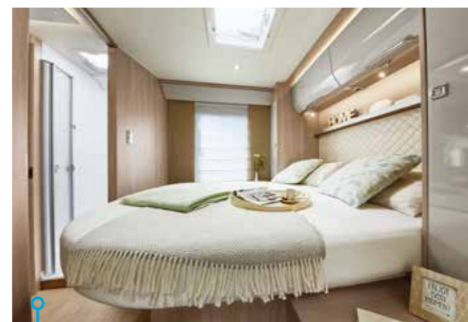
Både dubbelsängen och taksängen har femzoniga kallskummadrasser.