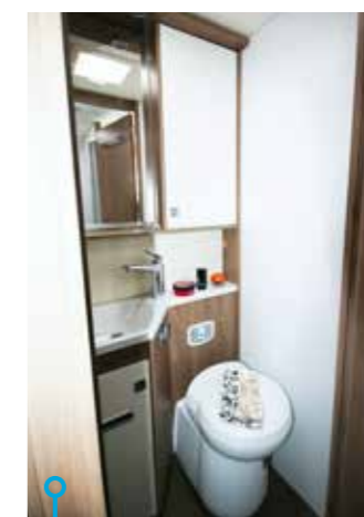
Funktionellt toalettutrymme, separerat från...