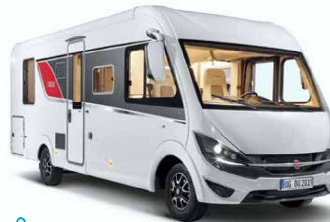
Bürstner har varit två i registreringsstatistiken sju av de åtta senaste åren.