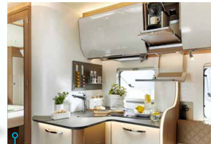
I köket finns något som oftast bara hittas i linermotorer – ett kaffeskåp.