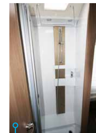
...duschen som har handdukshållare och taklucka.