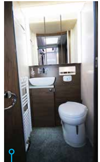
Här finns bland annat keramikskål och SOG-toalettavluftning.