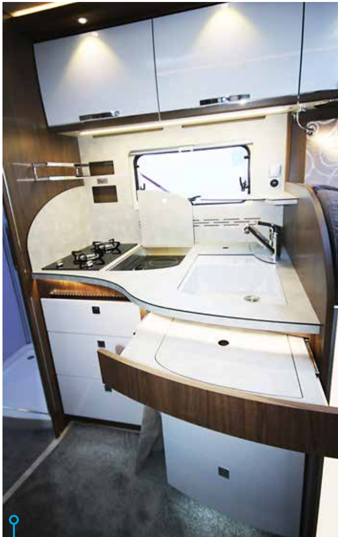
Med hjälp av täckplattorna skapas bra arbetsutrymme i köksavdelningen.

Stannar till vid en grusplan och med hjälp av backkamerans dubbla linser ställs fordonet tillrätta. Passar på att syna bilen utvändigt, öppnar garage's alla tre dörrar. Det är stort och rymligt, mäter 124 centimeter från golv till tak. Det innebär i klartext att skrymmande ting som cyklar, moped, golf- och grillutrustning enkelt får plats. Lastskenor med öglor finns tillgängligt, precis som elcentral, omvandlare, 12- och 230-uttag. Passar även på att öppna alla luckor, så här i adventstider. Känslan av att allt är stadigt och robust konstruerat är lika uppenbar som att Frankia tycks ha gjort allt så enkelt och smidigt som bara är möjligt. Läser oss till att det finns omvandlare på 1700 watt, extra gelbatteri 80 Ah inklusive extra laddare på