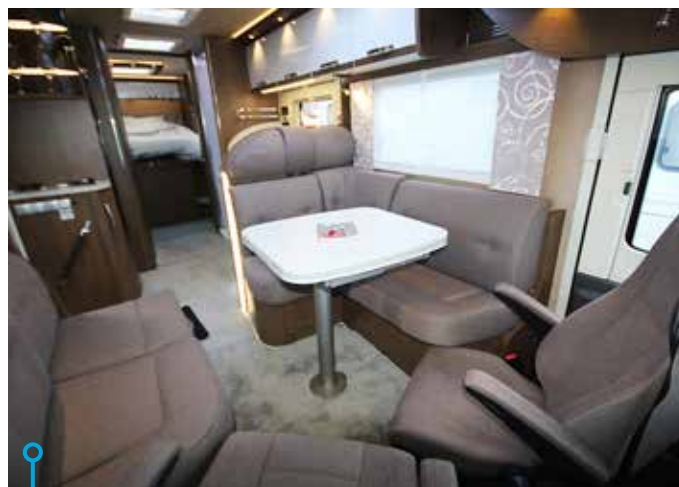
Gott om utrymme, bra svankstöd och högkvalitativ komfort i sittgruppen.

utrustad med vattenburen centralvärme från Alde.