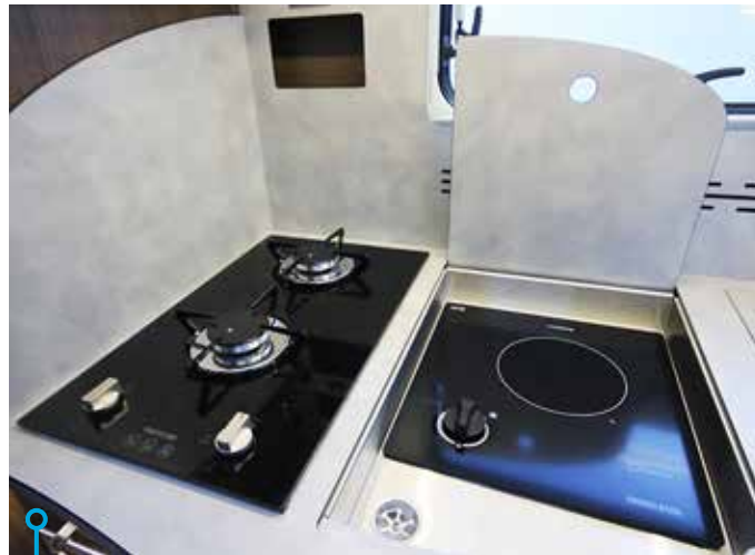
Elektrisk kokplatta gillas skarpt av de flesta husvagns- och husbilsampare.

DET FINNS MASSVIS med godsaker som vi inte ser med blotta ögat. Exempel på det är frostskyddade tankar, Seitzfönster och den träfria karosbyggnaden som inkluderar glasfiberförstärkt tak. Väg- och takkonstruktionen är för övrigt utvecklad in house av Frankia. Via systemet Thermo Guard Plus gäller hela tio års täthetsgaranti, förutsatt att de årliga testerna sköts inom föreskrivna intervaller. Som grädde på moset är 840:an