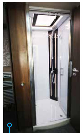
I duschen finns stång för våta kläder.