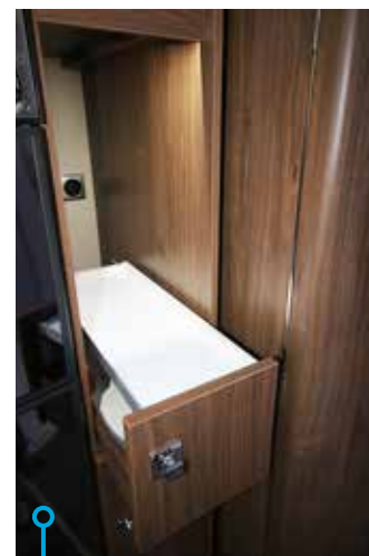
Utdragbar kaffehörna med tillhörande eluttag.

NÄR VI TITTAR PÅ specifikationerna på just denna husbil visar det sig att den är extrautrustad för dryga 200 000 kronor. Som att göra extra premium till super extra premium, eller något åt det hållet. Praktiska och fashionabla lösningar finns inte bara exteriört utan även i bodelen. Bland annat en kaffehörna som är anpassad för just kaffemaskinen. Det går ju inte att förbise att vi svenskar ligger på andra plats i världen när det gäller kaffedrickande. En annan användarvänlig detalj är den elektriskt justerbara huvudändan i dubbelsängen. Något som dels ökar komforten och dels gör att utrymmet vid fotändan blir öppnare. Rymliga klädsåp på var sin sida om