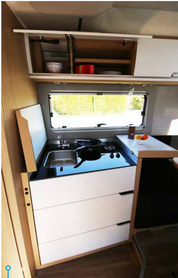
Vik klaffarna åt sidan och såväl spis som arbetsbänk blir tillgängliga för matberedning.

SMOVE ÄR EN HUSBIL som får oss campingentusiaster att höja ett ögonbryn eller två. Fräck exteriör design i kombination med många innovativa lösningar invändigt. Bilen känns futuristisk, det är en husbil med egen identitet – spännande.