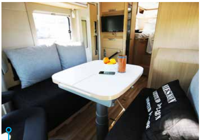
I många husbilar står hyttstolarna för bästa komforten runt bordet. Hos Smove är sofforna i topp.

kvadratmeter. Det ska finnas säng eller sängar, sittgrupp, köksavdelning och hygienutrymme. Plussa sedan på med utrymme för persedlar som i vissa fall är skrymmande. Här