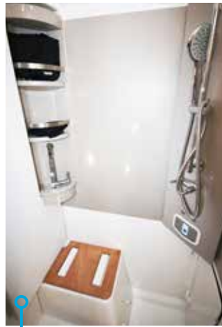
Vrid handfatsmodulen och ett stort duschutrymme uppenbarar sig.

SMOVE HAR OCKSÅ en mängd andra komponenter som både förenklar och förgyller en hus-