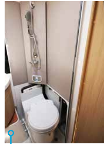
Med två knapptryck trollass den dolda toalettstolen fram.