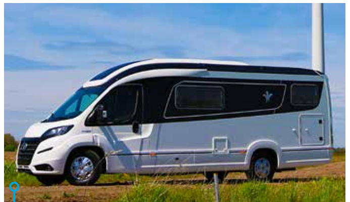
Vår testbil hade fälgar av stål, men den kommer att levereras till sina kunder med aluminiumfälgar.

bilsemester. Dold backkamera under dess logo, lastöglor i garaget, utedusch, rikligt med 230-uttag, Froli Stars madrasssystem, markis med dimbar LED-belysning, solcellsanläggning, centrallås för garage/bodelsdörr, dubbelgolv med varmluftsutsläpp och konvektorer, dvd-spelare, förstärkt bat-