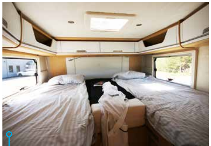
Smove finns i fyra utföranden där 6.9-modellerna har tvärställd säng medan 7.4E och 7.4B har höga långbäddar.