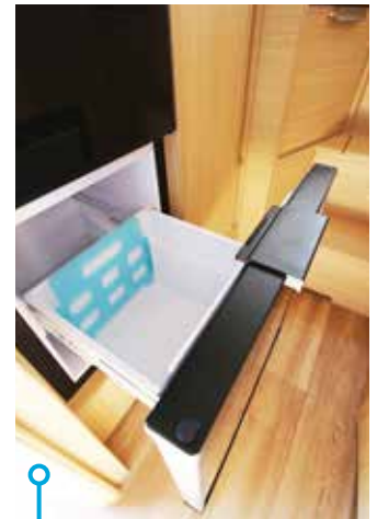
Kyllåda under kylskåpet är en uppskattad detalj.