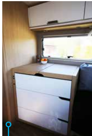
Ett kompakt kök som mer påminner om ett sideboard.

NU ÄR DET INTE FÖRSTA gången Husvagn & Camping tittar närmare på Smove. Första gången var vid premiärlanseringen i samband med Caravan Salon i Düsseldorf för snart ett år sedan. Nu får jag dock möjlighet att ägna bilen betydligt mer tid, och mitt första intryck är att Smove är lika häftig som den tillfälliga parkeringsplatsen jag funnit. Som bekant lär det uppstå huvudbry för konstruktörerna att finna lösningar som är optimala för sisådär 15