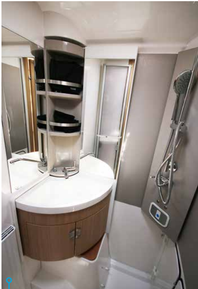
Hygienutrymmet i utförandet med tillgängligt handfat.

INNAN JAG GÅR HUSESYN vill jag premiera en välkomnande entré med skolåda, dold kontrollpanel, tv och ett rejält handtag som gör det enkelt och säkert att ta sig in i och ut ur fordonet. Vi börjar med hygienutrymmet som man kan kalla ett tre-i-ett-system. Ett – i sitt grundutförande är handfattet för tvätt och tandborstning tillgängligt. Två – vrid undan handfattet och ett stort duschutrymme trollass fram samtidigt som handfattet förblir dolt. Tre – via två knapptryck åker den dolda toalettstolen fram ur ett skåp. Snillrikt och platsbesparande.