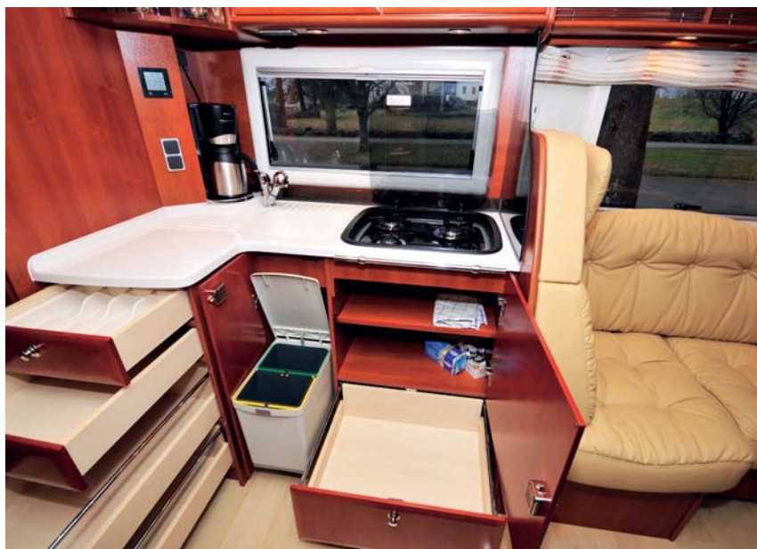
Köket är lättarbetat och funktionellt. Lådorna har underbar känsla och är mjukstängande.

Sovrummet hårbärgerar två långbäddar. För att kunna erbjuda rejält garage är sängarna högt placerade, i högsta laget, men de är inga himlasängar så