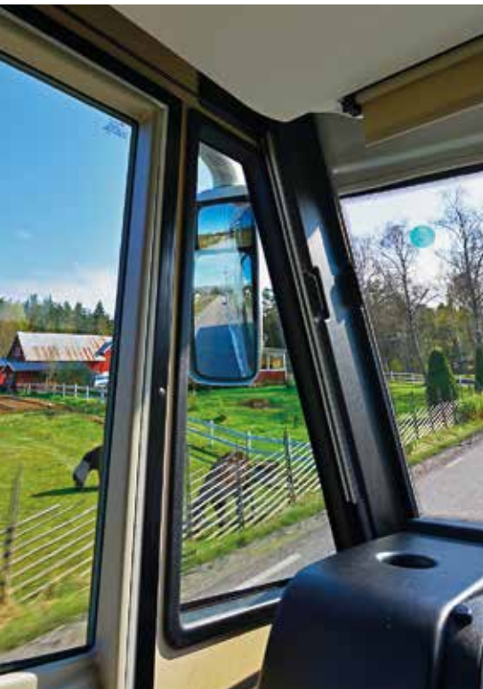
▲ Spegelarna är stabila och ger god koll.