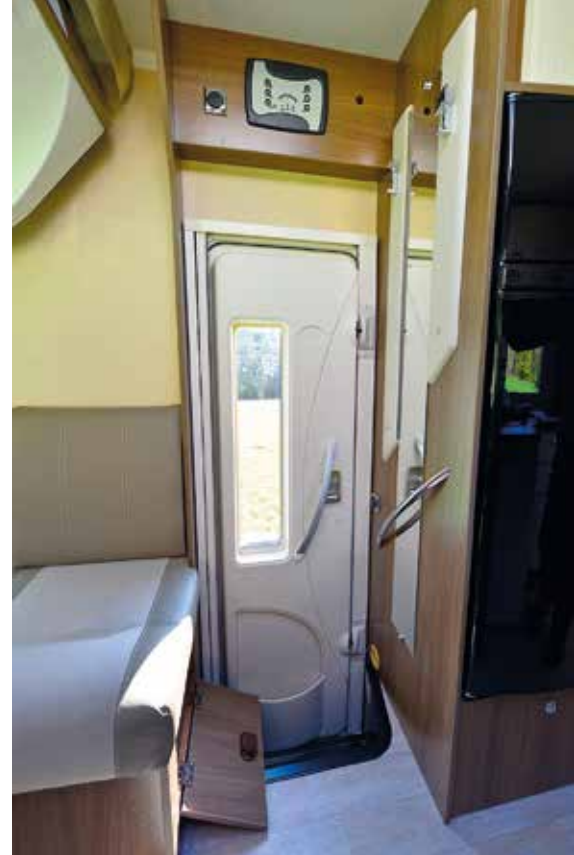
▲ En hall värd namnet. Klädkrokar, skofack, fönster i dörren. Svårare är det inte.

till duschkabinen rackliga och inte i nivå med resten av bilen. I övrigt har vi inget att invända på hygienavdelningen. Plus i kanten för fönstret i toaletten. Ljusinsläpp, utsikt, vädning.