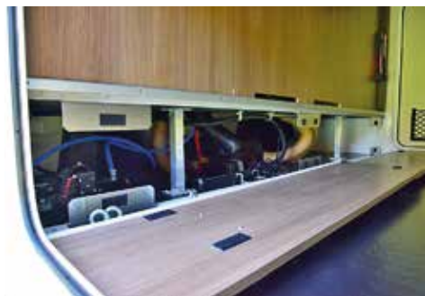
◀ ▲ Garaget är rymligt, öppnar från båda håll, men inte lika stort. Skenor med flexibla fästpunkter. Belysning. Uppvämt. Sidohängd dörr med nätficka. Bakom luckor hittar vi servicepunkter för värme och VVS.