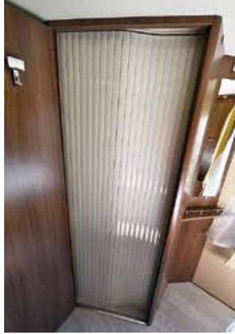
▲ Badrummet är delat. Toa på den ena sidan, dusch på den andra. Toalettdörren kan användas för att dela av bilen. Vill man ändå ha en avskild toalett finns en extra jalousidörr att tillgå – vaket! Tyvärr är dörrarna

till duschkabinen rackliga och inte i nivå med resten av bilen. I övrigt har vi inget att invända på hygienavdelningen. Plus i kanten för fönstret i toaletten. Ljusinsläpp, utsikt, vädning.