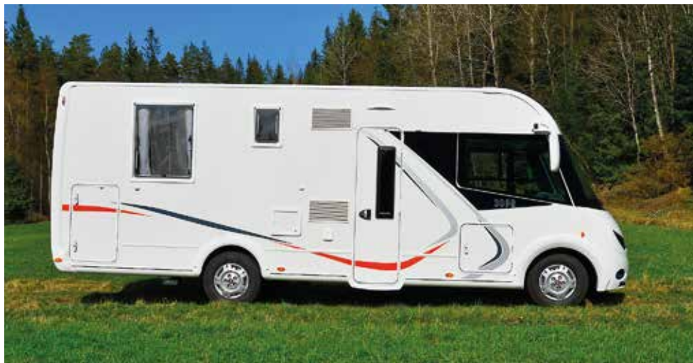
▲ Överhänget är rejält och garaget rymligt. Packa med omsorg så du inte äventyrar vägegenskaperna.

Vi lånade bilen av Forsbergs Fritidscenter i Hyssna