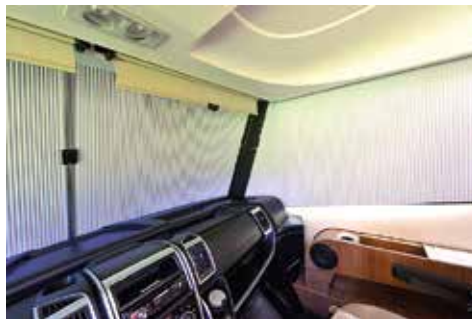
▲ Plisséer insynskyddar och mörklägger.

En välutrustad förarmiljö där man sitter bekvämt. Rutans nederkant är nerdragen en bit vilket skapar en god körkänsla. ▶